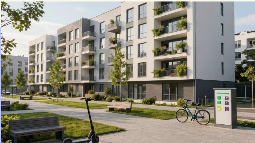
Свежие идеи и инновации